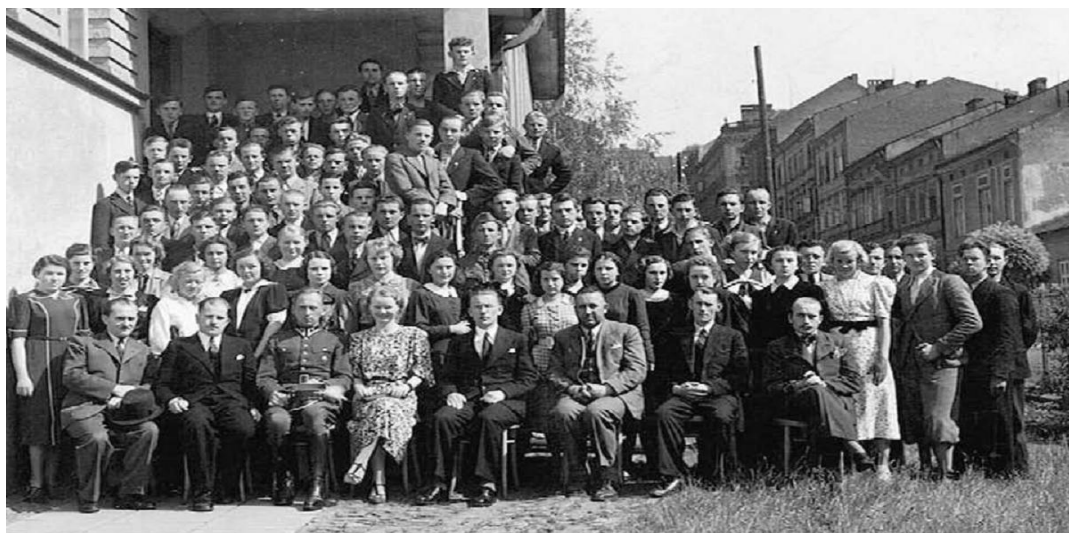
Uroczystość zakończenia roku szkolnego 1937/38 w Publicznej Szkole Doksztalczącej Zawodowej przed budynkiem na Placu Wolności 7.