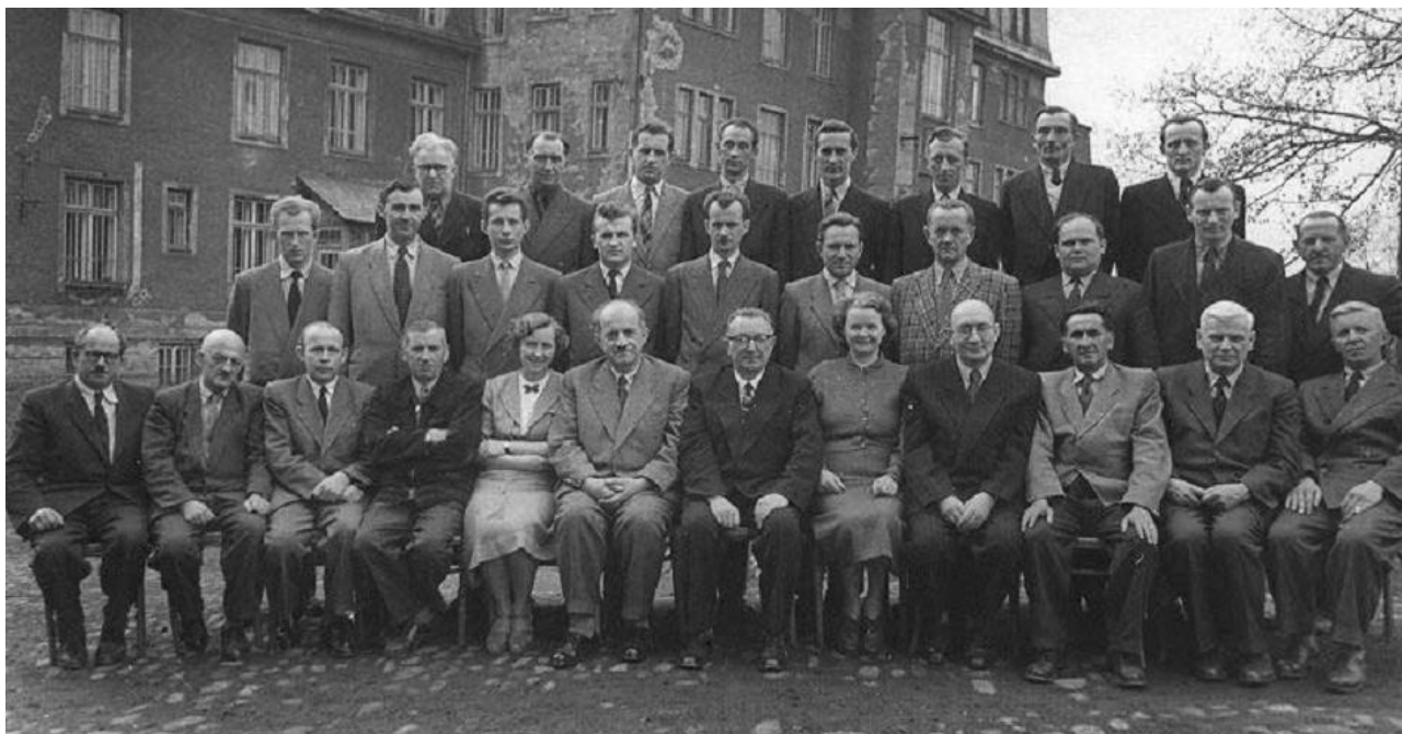
Grono Pedagogiczne Zasadniczej Szkoły Mechanizacji Rolnictwa w Cieszynie w roku 1959.